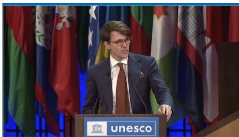
Statssekreterare Erik Scheller håller tal i Unesco.

Under Unescos generalkonferens träffades runt 3 000 deltagare från 194 medlemsländer i Paris för att ta fram målsättningar för det kommande arbetet. Resultatet blev bland annat beslut kring rekommendationer och resolutioner liksom val till Unescos styrelse.