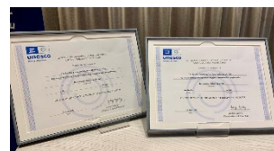
Certifikaten som intygar att Riksarkivet och Kungliga biblioteket förvarar Sveriges världsminne