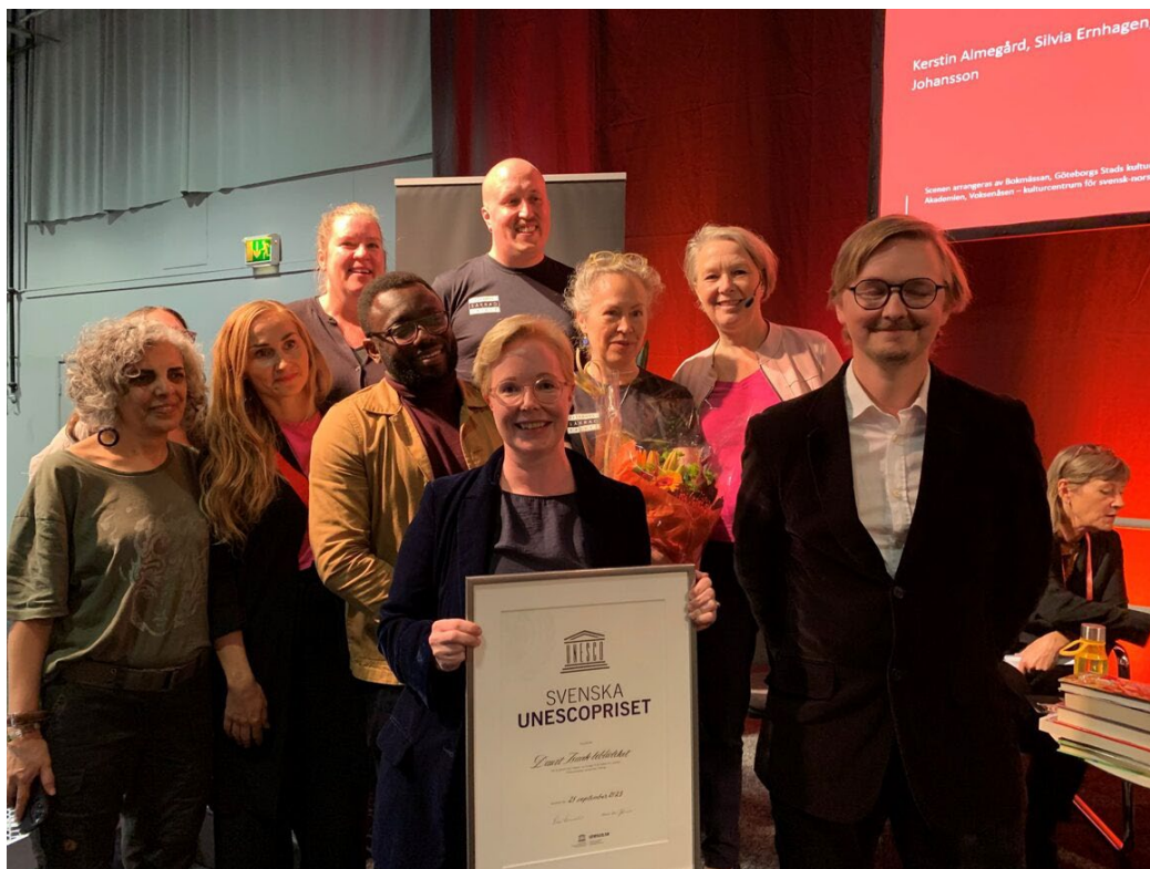
2023 års Svenska Unescoprisset gick till Dawit Isaak-biblioteket för deras arbete för yttrandefrihet.