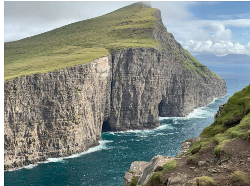
Färöarnas vackra natur.