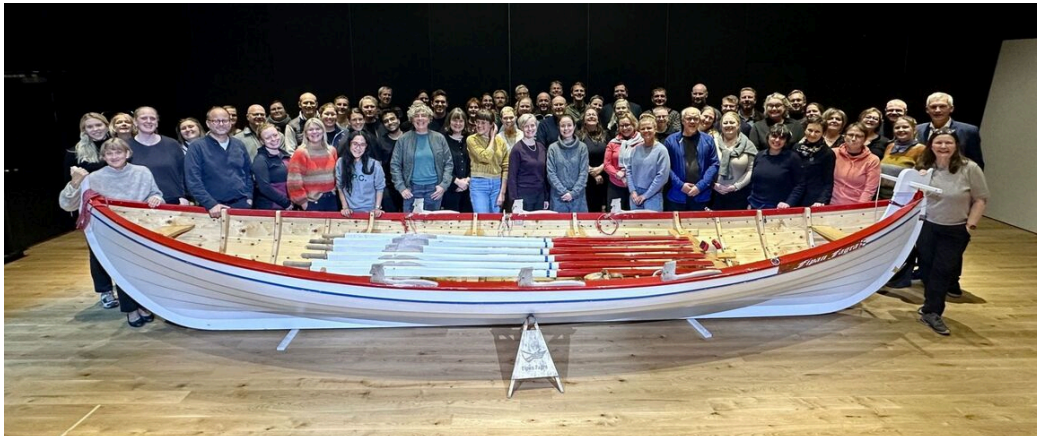
Nordiska nationalkommissionerna framför en färöisk klinkbåt, ett immateriellt kulturarv.

Det årliga mötet mellan de nordiska nationalkommissionerna hölls i år på Färöarna. Under mötet diskuterades bland annat hur de nordiska länderna ser på Unescos nya program och budget, den kommande generalkonferensen i november samt möjliga samarbeten inom den nordiska kretsen.