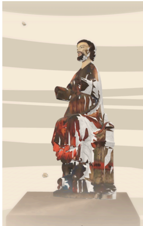
Träskulpturen Sankt Olof i det virtuella museet.