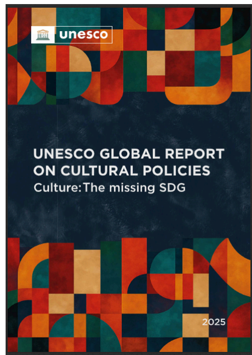
Unescos rapport går att läsa här. Klicka på bilden.

I Gaza och Sudan har Unesco till exempel använt sig av satellitbilder, stärkt det regionala samarbetet och bidragit till att skydda platser som hotas av konflikter eller plundring.