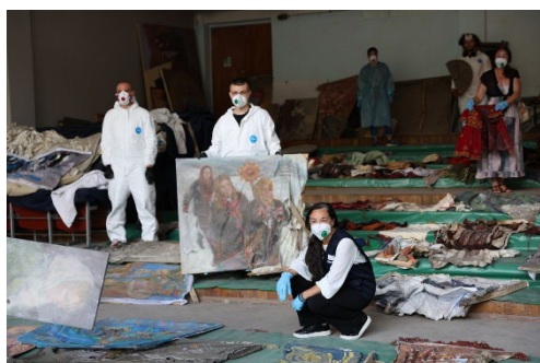
Arbete pågår på fältet.

– Med det svenska stödet kan vi reparera och bygga upp skolor och skyddsrum i flera regioner, och förbättra lärmiljön för barn med särskilda behov. Jag vill jag rikta ett stort tack till Sveriges regering för detta betydelsefulla bidrag till barnen och hela utbildningssystemet i Ukraina, säger Chiara Dezzi Bardesch från Unescos kontor i Ukraina.