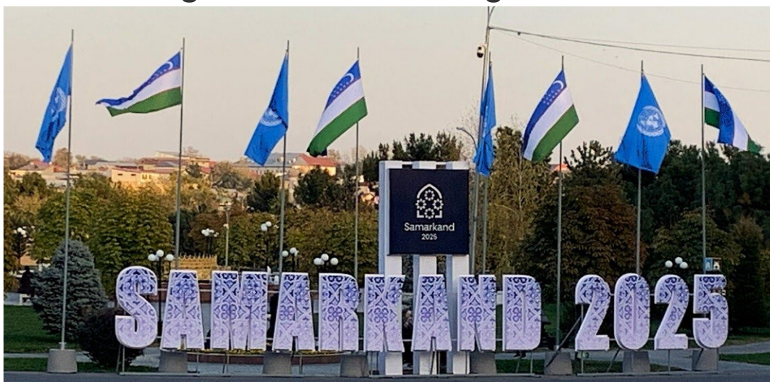
För första gången på 40 år ägde Unescos generalkonferens inte rum i Paris, utan i Samarkand.

Unescos generalkonferens samlade i år medlemsstater från hela världen i Samarkand, Uzbekistan, mellan den 30 oktober och den 13 november. Det var första gången på 40 år som mötet hölls utanför Paris.