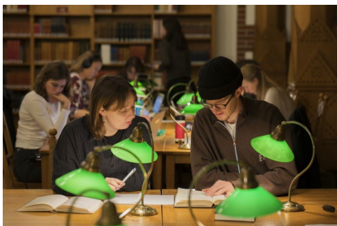
Universitetsbiblioteket, Tegnérsalen.

Att Lund blir litteraturstad inom Unescos nätverk är ett internationellt erkännande av stadens levande litteraturliv där fria aktörer, författare, civilsamhället, universitet, näringsliv och offentlig sektor bidrar till mångfalden inom området.