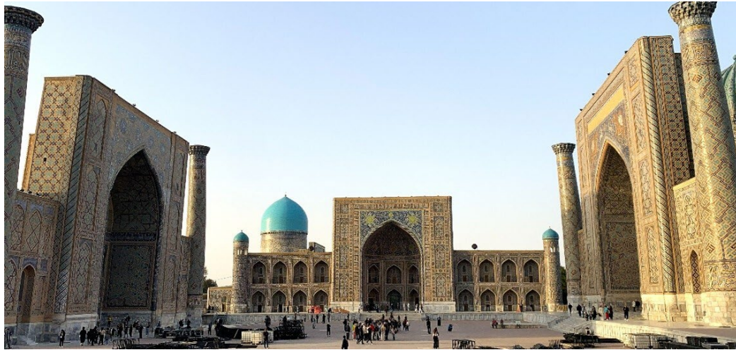
Registan i Samarkand är ett Unesco världsarv.

Årets möte i Uzbekistan visade att engagemanget för Unescos frågor är fortsatt starkt och att organisationen fortsätter utvecklas.