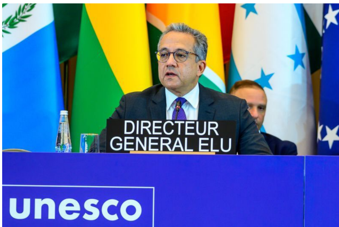
Khaled El-Enany, Unescos nya generaldirektör, på generalkonferensen 2025.

El-Enany är vald på fyra år och blir den 12:e generaldirektören för Unesco.