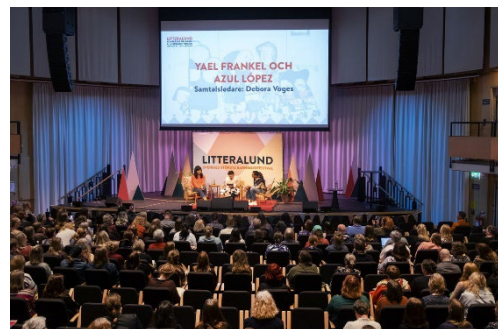
Litteralund 2025.