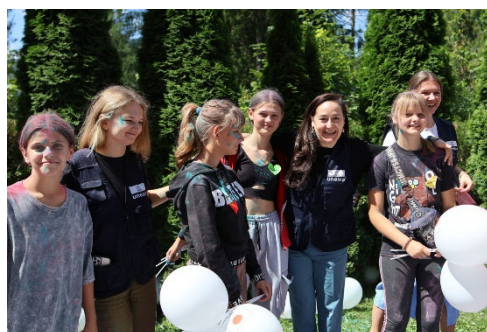
Utbildning är grundläggande för resiliens.